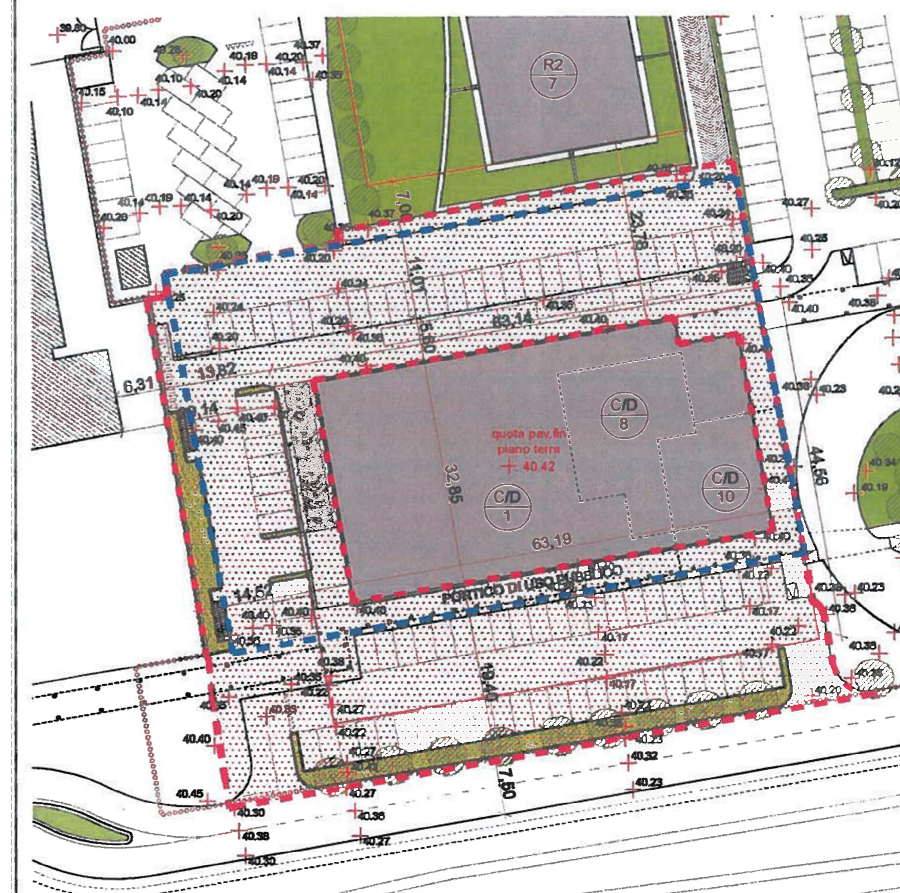
Planimetria 1:500 _ piano quotato - distanza da edifici e strade - altezza edifici