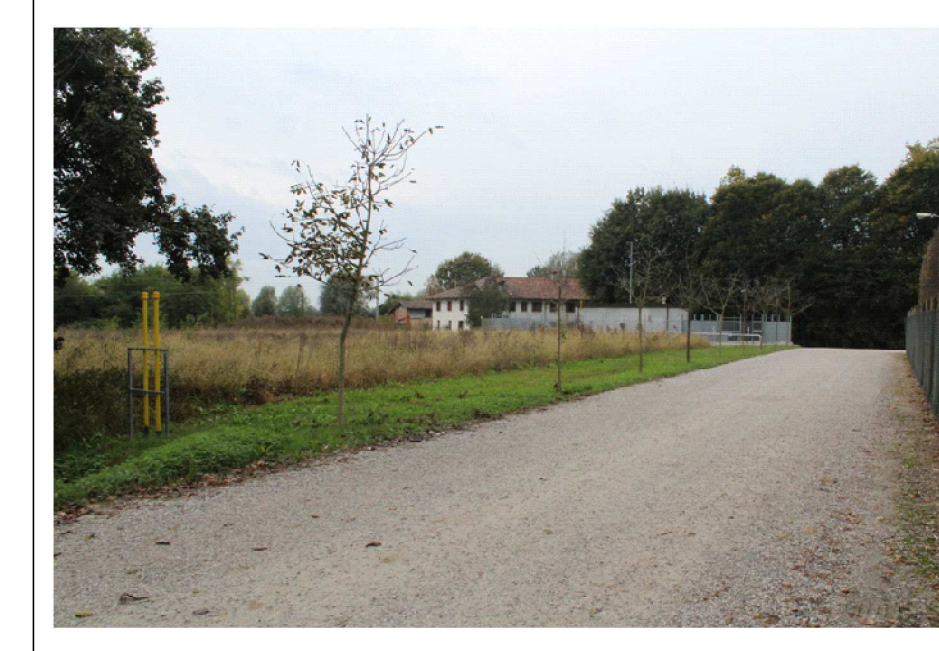
FOTO 1: inquadrate dal reattore anaerobico dei terreni (prima della realizzazione della di riduzione del metano)