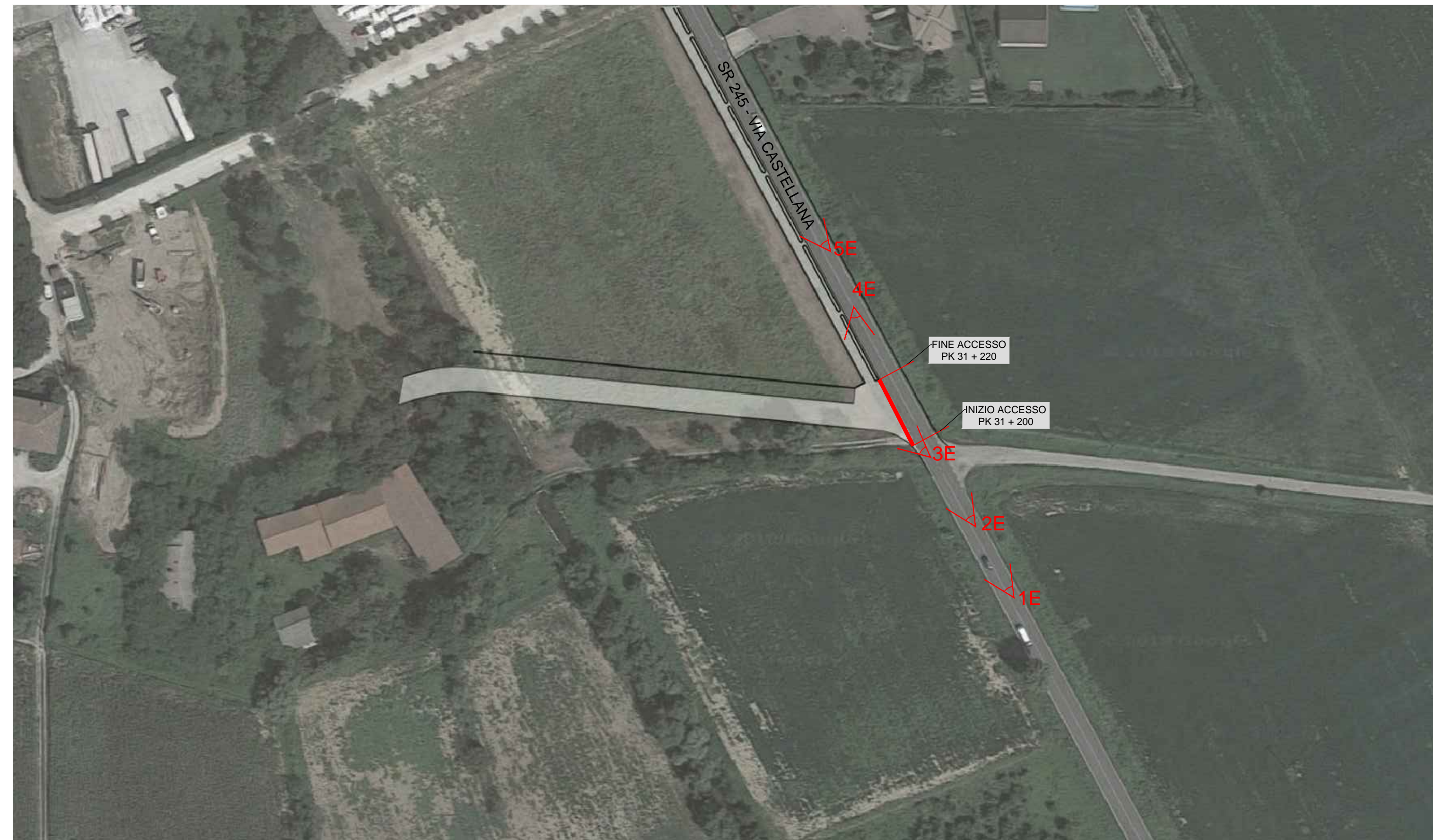
FOTO AREA DI PROGETTO CON INSERIMENTO INGOMBRO NUOVO ACCESSO

REGIONE VENETO COMUNE DI CASTELFRANCO V. PROVINCIA DI TREVISO