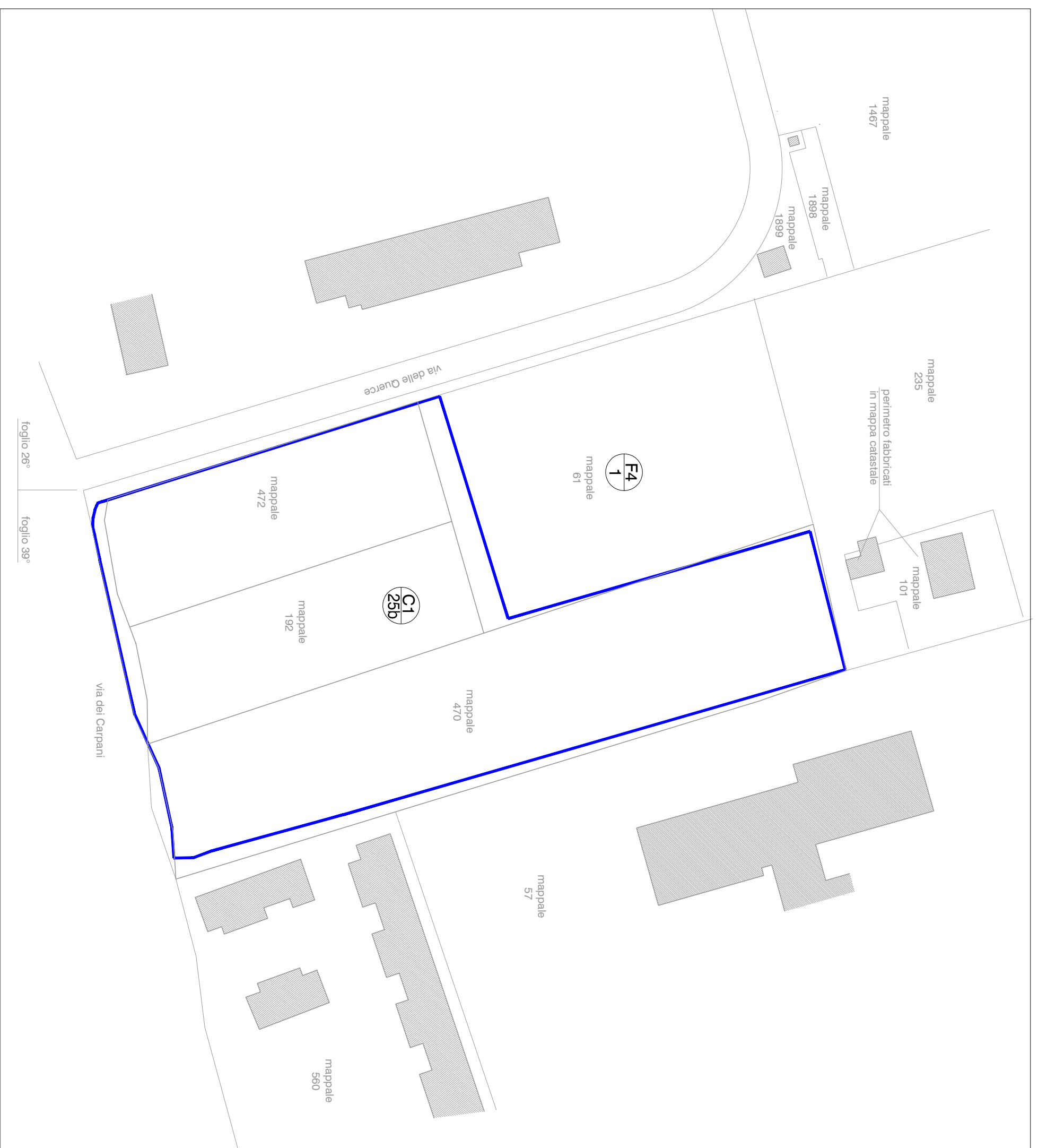
Planimetria area P.U.A. da P.I.

Scala 1:1000 — Perimetro P.U.A. come previsto dal P.I.