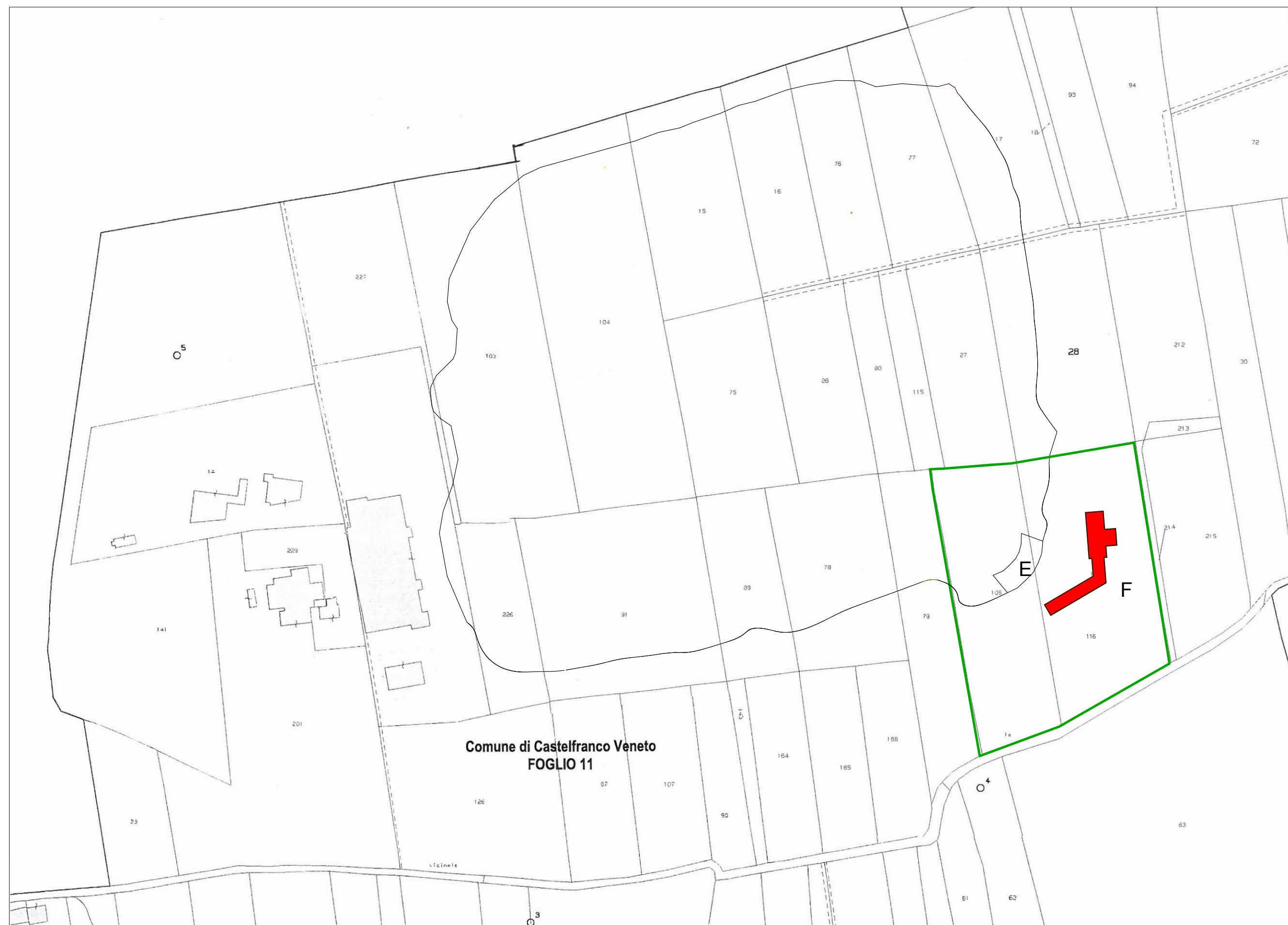
ESTRATTO MAPPA CATASTALE Comune di Castelfranco Veneto - Fg. 11 Mapple 105 - 116